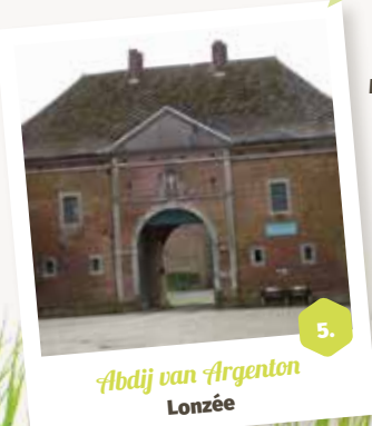
5. Abdij van Argenton Lonzée