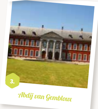
3. Abdij van Gembloux